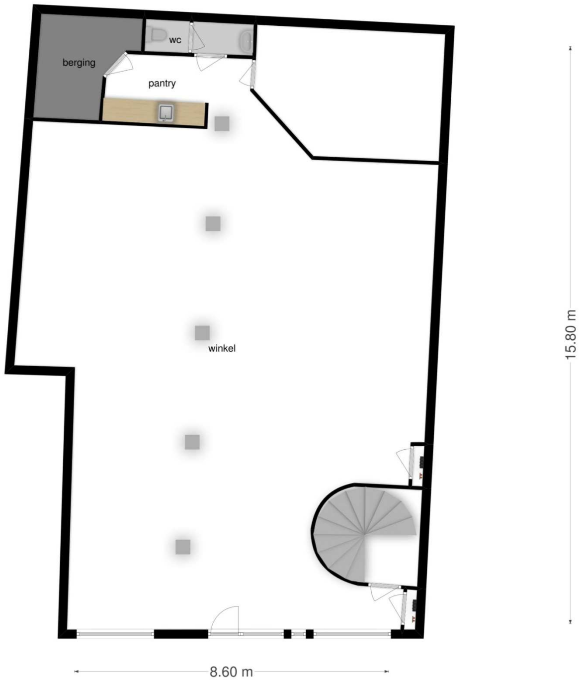
Plattegrond begane grond