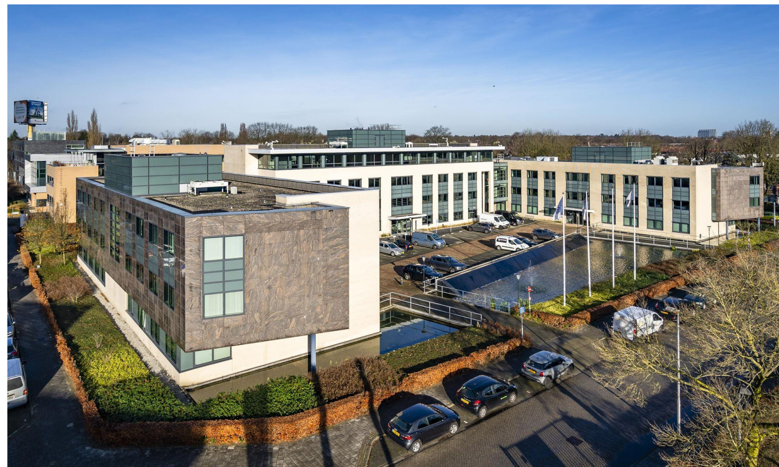
Dr. Holtropaan 2-28 te Eindhoven