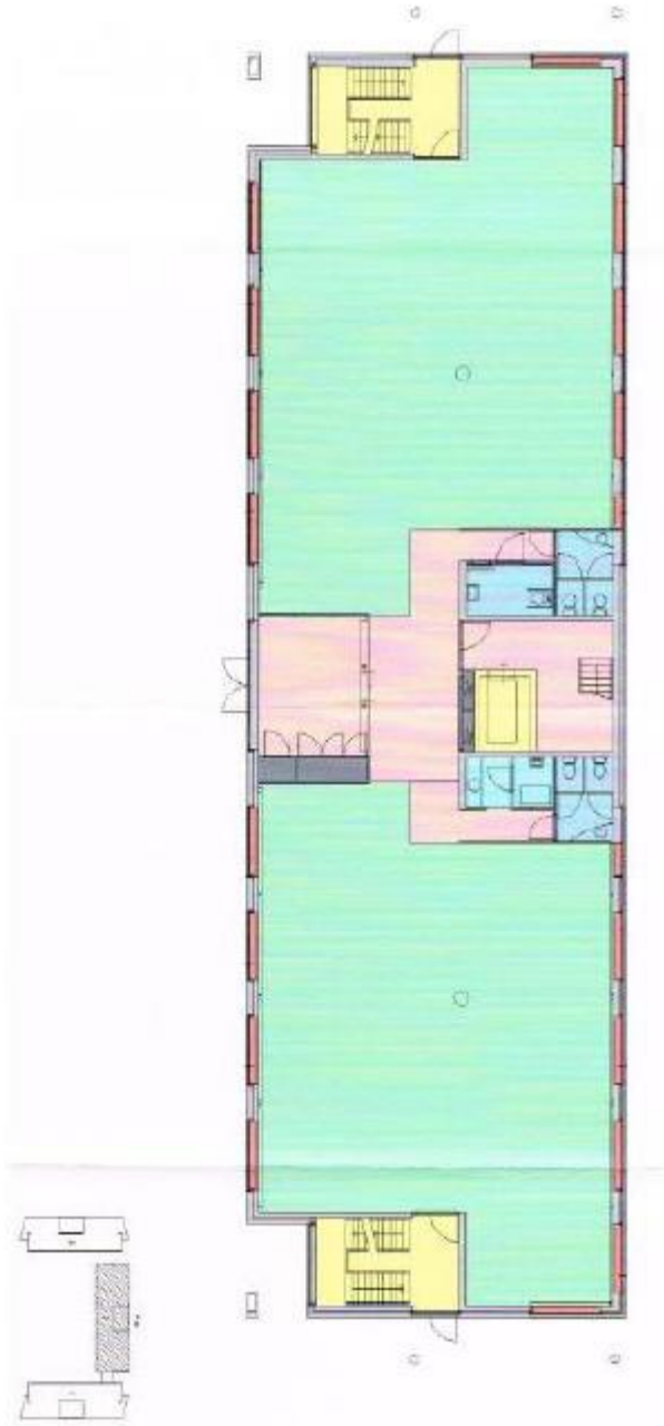
Plattegrond Gebouw B – Begane grond