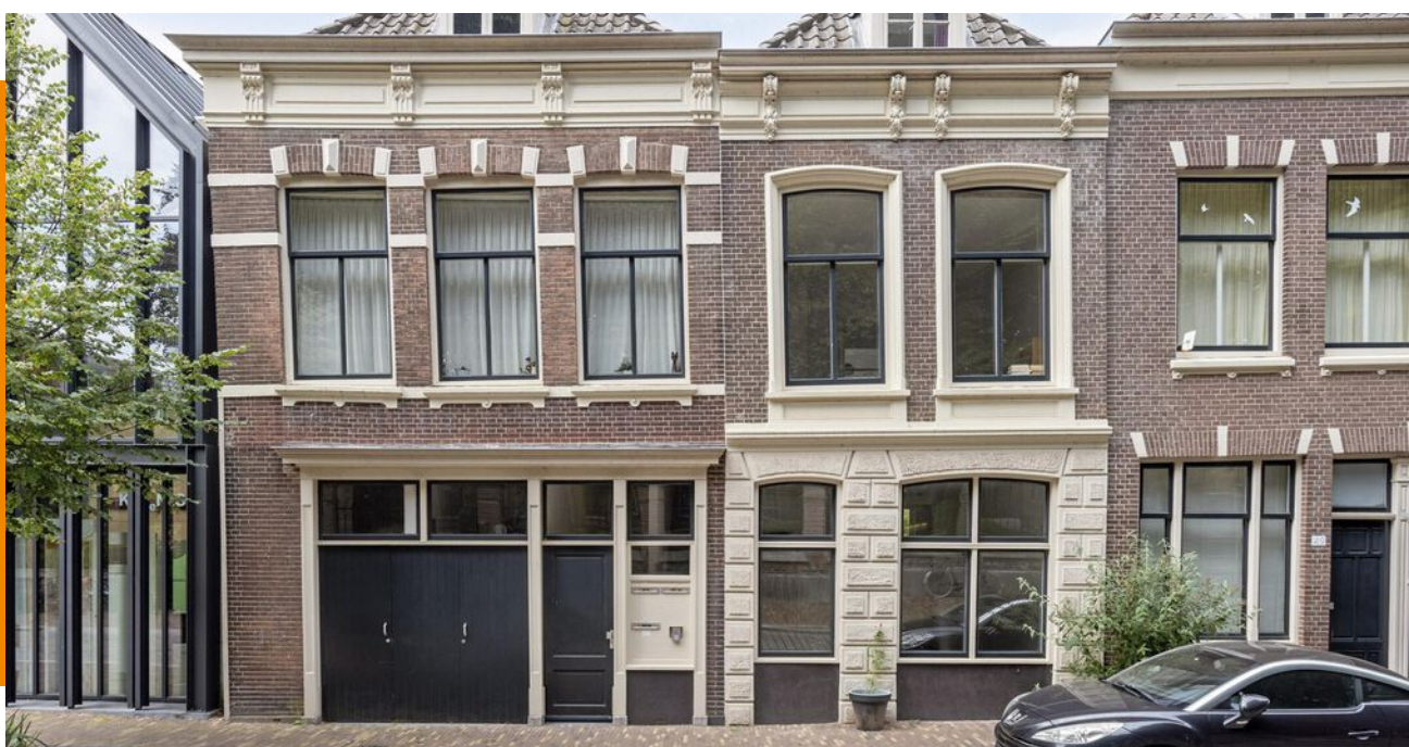
MUSEUMSTRAAT 57 • DORDRECHT