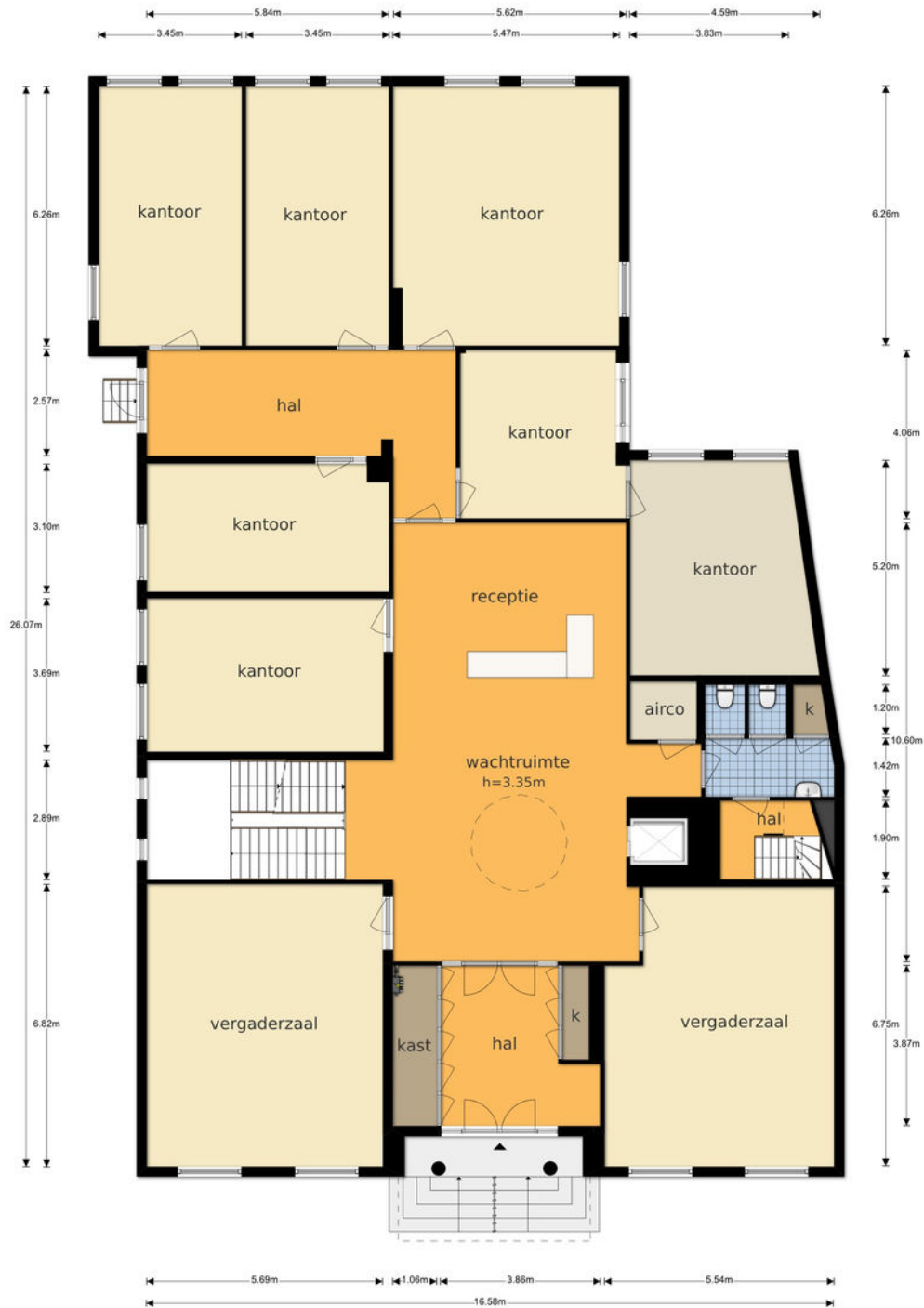
Maliebaan 10A - Utrecht Begane Grond

De plattegronden zijn geproduceerd voor promotionele doeleinden en ter indicatie. Aan de plattegronden kunnen geen rechten worden ontleend © www.objectenco.nl