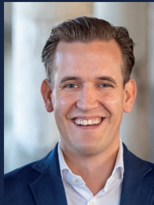
Arjen van Emmerik Molenbeek Makelaars