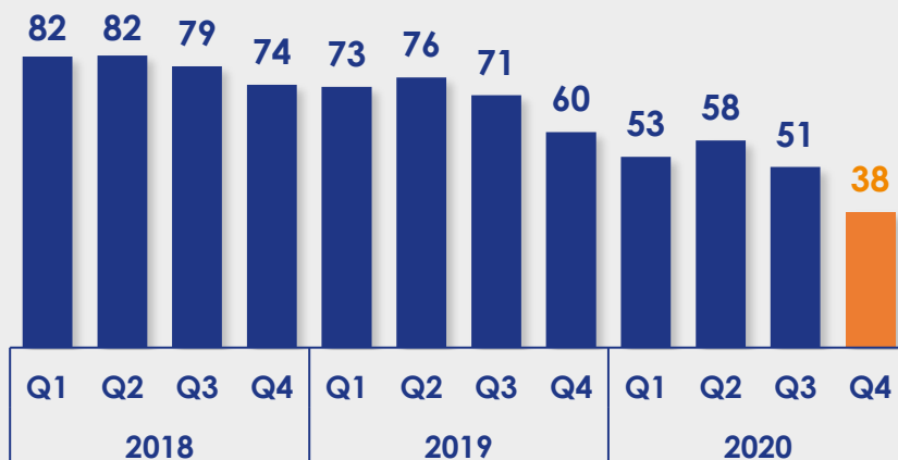
Aanbod aan het eind van het kwartaal in duizendtallen