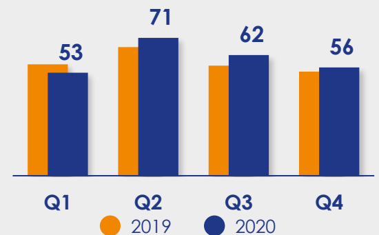
Aanmeldingen woningaanbod bestaande bouw in duizendtallen